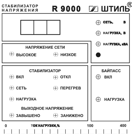
Рис.1. Внешний вид передней панели стабилизатора

Шкала индикаторов “Ток нагрузки, %” показывает величину тока подключенной к стабилизатору нагрузки в процентах от допустимого значения.